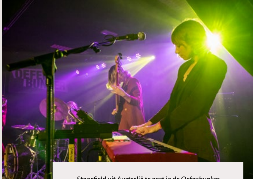
Stonefield uit Australië te gast in de Oefenbunker

Enfin, opnieuw een jaar waar ik vol trots en tevredenheid op terug kijk. Naast de vele bijzondere optredens en events waren er ook nieuwe initiatieven, werd de samenwerking met diverse partners in Parkstad Popstad op verschillende vlakken uitgebouwd, en last, but zeker not least kregen we van de gemeente Landgraaf aan het eind van het jaar de toezegging voor structurele subsidie voor duurzame talentontwikkeling. Een beloning en vooral bevestiging dat we als stichting samen met onze vrijwilligers iets goeds hebben neergezet de afgelopen jaren. Iets dat zijn culturele en maatschappelijk bijdrage in Landgraaf en Parkstad heeft bewezen en waarvoor we ons zullen blijven en nu ook echt kunnen inzetten.