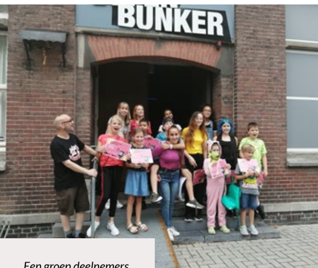
Een groep deelnemers aan Snuffelpop 2019

In 2019 werd door de Oefenbunker een geluidscursus voor gevorderden georganiseerd, die opnieuw op grote belangstelling mocht rekenen. In verband met kwaliteit van de cursus is het aantal deelnemers echter beperkt en hebben in totaal 6 personen deelgenomen.