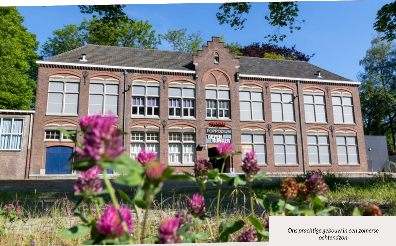
Ons prachtige gebouw in een zomere ochtendzon

De leerlingen en studenten zijn afkomstig van Vista College, Charlemagne college, Brandenburg college, Eijkenhage college, Cita Verde college