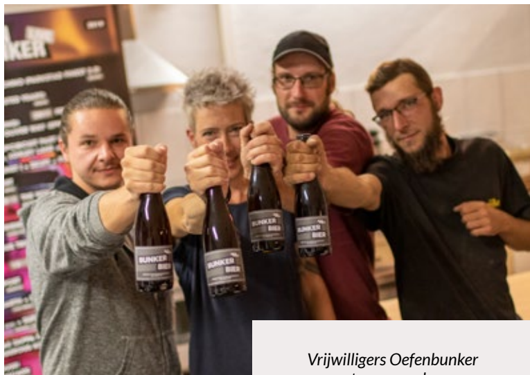
Vrijwilligers Oefenbunker promoten vers gebrouwen Bunker Bier

Het vrijwilligershandboek met spel- en huisregels en afspraken over “vrijwillig, maar niet vrijblijvend” voor met name nieuwe vrijwilligers geeft goede richtlijnen over welke rechten en plichten er gelden voor vrijwilligers. Onze vrijwilligers zijn immers de pijlers waarop alle activiteiten steunen, maar ze zijn tevens ook het visitekaartje richting bezoekers, leerlingen en muzikanten.